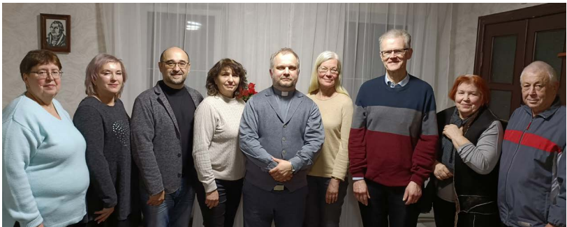
Församlingsmedlemmar, pastorn (5:e både fr vänster och fr höger) och gästande svenskar (nr 3 och 4 fr höger) i Krementjuk.

Två av församlingsmedlemmarna (mor och dotter) var lärare i engelska vilket verkligen underlättade samtalet för mig. Natten tillbringade vi sedan i ett hotell i Krementjuk.