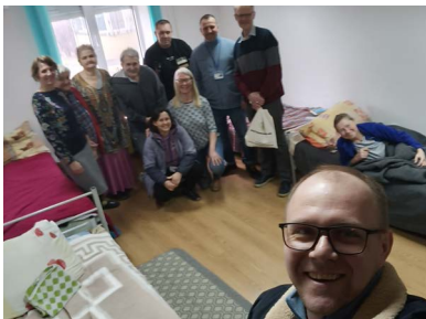
House of Mercy. Den som tar bilden är särskilt tydlig, medan de andra är i bakgrunden.

På onsdagen (6/3) var vi ute och såg det fantastiska arbete som DELKU och andra kyrkor/föreningar gör i House of Mercy och som även NÖ har stöttat i flera år. House of Mercy tar