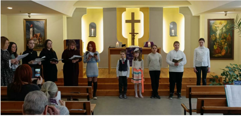
Från gudstjänsten i Charkiv. Man ser koret "som Waldemar byggde".