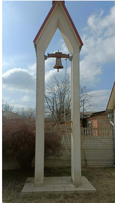
Klockstapel med klockan som ringer till gudstjänst i den lutherska kyrkan, i staden Poltava som överlevt inte bara 1709 års krig.