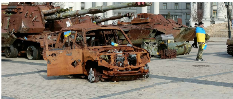
Krigsskrot i Kiev.

Lördagen 2/3 anlände vi Kiev tidigt på morgonen. Här togs vi emot av Eugene (bror till Ihor Sjemihon).