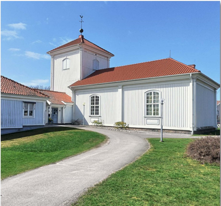
Träslövsläge kyrka, där NÖ hade sitt årsmöte.