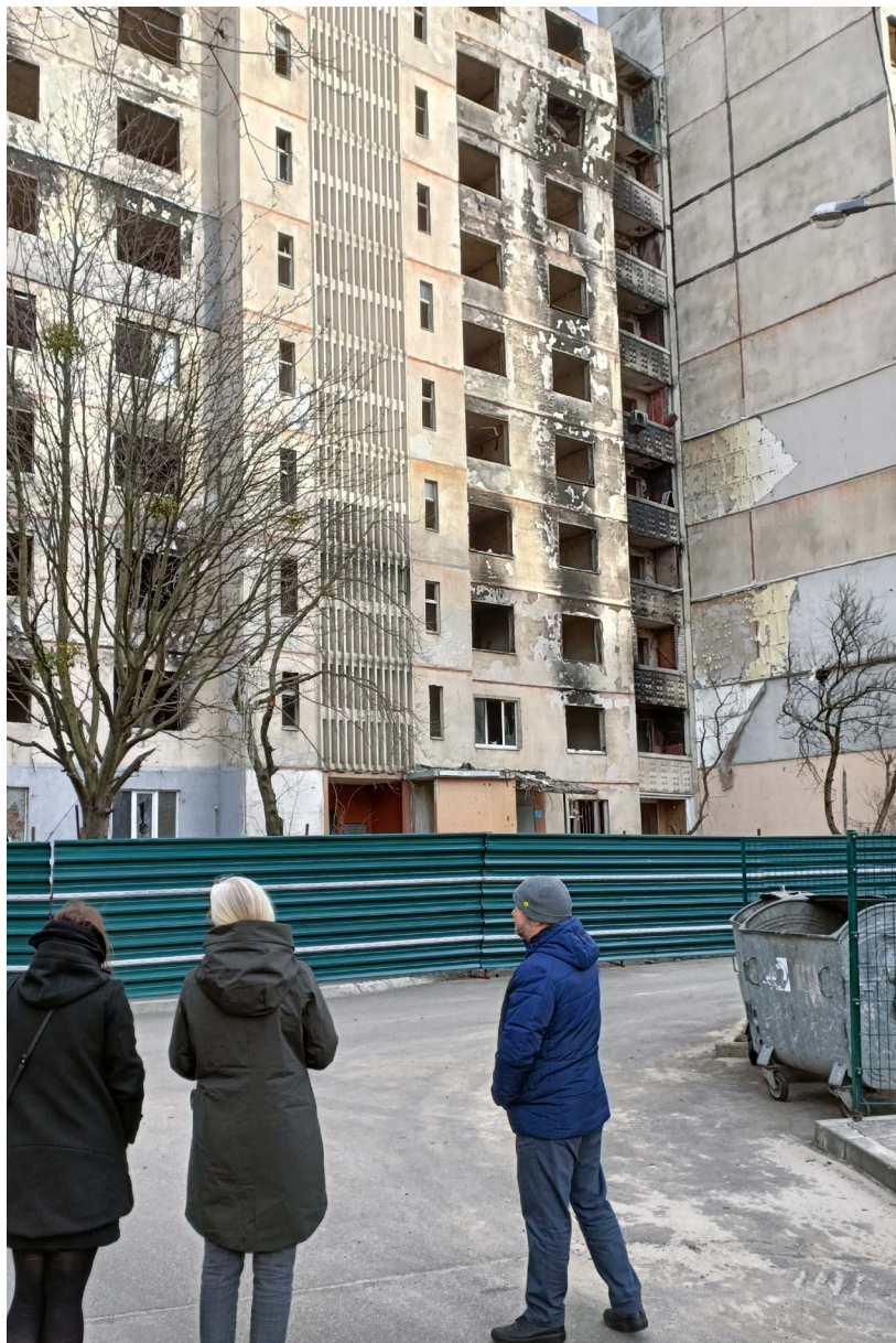
Även i Charkiv har kriget dragit fram.