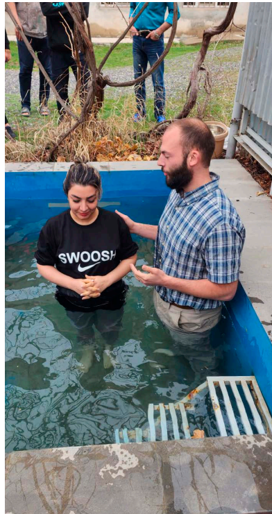
Genom dopet upptagen i Kristi församling.

men hur skulle det bli möjligt? Tony och hans medarbetare funderade vidare. Då föddes idén om att låta människor komma till ett grannland som turister. De bjöds in till Armenien, 30-35 människor per tillfälle. Där fick de undervisning i bibeln. När de kom var alla rädda och misstänksamma mot varandra, eftersom de trodde att de var de enda som hade konverterat från