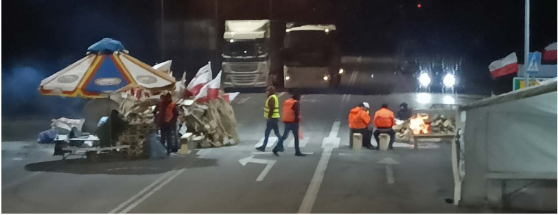
Nordisk Östmissions styrelsemedlemmar får gilla läget även vid gränsen mellan Polen och Ukraina.

När vi på natten passerade gränsen och skulle köra in i Polen blev vi stående i flera timmar i väntan på att bli insläppta i Polen. Vi såg då hur polska bönder blockerade gränsövergången eftersom man är så kritisk till att ukrainska bönder inte längre behöver betala tullavgifter och därmed får en extra stor konkurrensfördel mot de polska bönderna. Men till sist kunde vi passera gränsen och fick då se hur säkert tusentalet (jag räknade dem inte) lastbilar stod och väntade på att passera gränsen för att komma in i Ukraina.