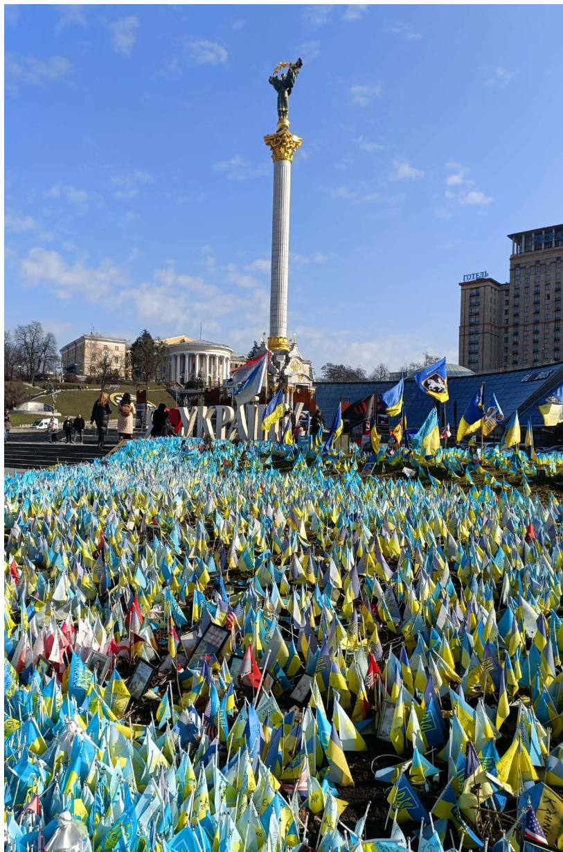
På Majdantorget hedras de stupade.