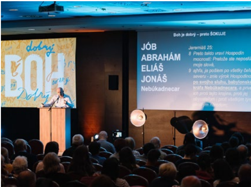
Bilder från EVS-konferensen 2022.