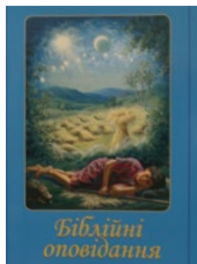
Denna bok innehåller bibliska berättelser på ukrainska.