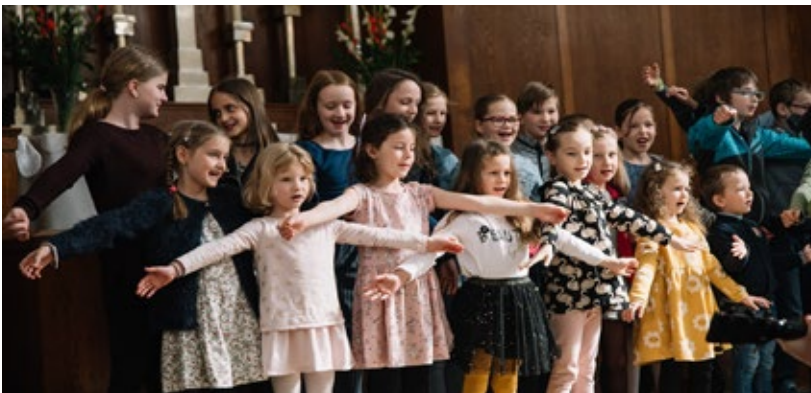
Bilder från EVS-konferensen 2022.