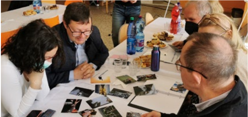
Från ett seminarium inom EVS.