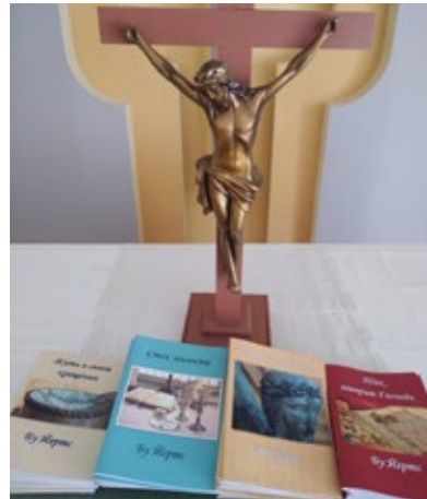
Bild på skrifterna av Bo Giertz.

Vi redovisar gåvorna kvartalsvis. Det betyder t.ex. att namnet på den som blivit hyllad i juli inte kommer med i vår tidning förrän i nummer 4. Övriga upplysningar lämnas av kassören.