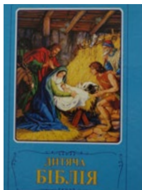
IFB:s välkända barnbibel finns på många språk. Här är den ukrainska utgåvan.

IFB (Institutet för Bibelöversättning) har också lovat barnbiblar och en bok med bibliska berättelser på ukrainska som vi skulle kunna skicka med i vår nästa leverans.