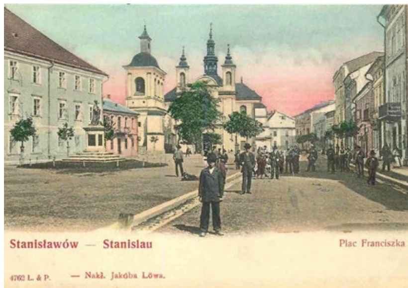
Vykort från 1904 då staden hette Stanisławów