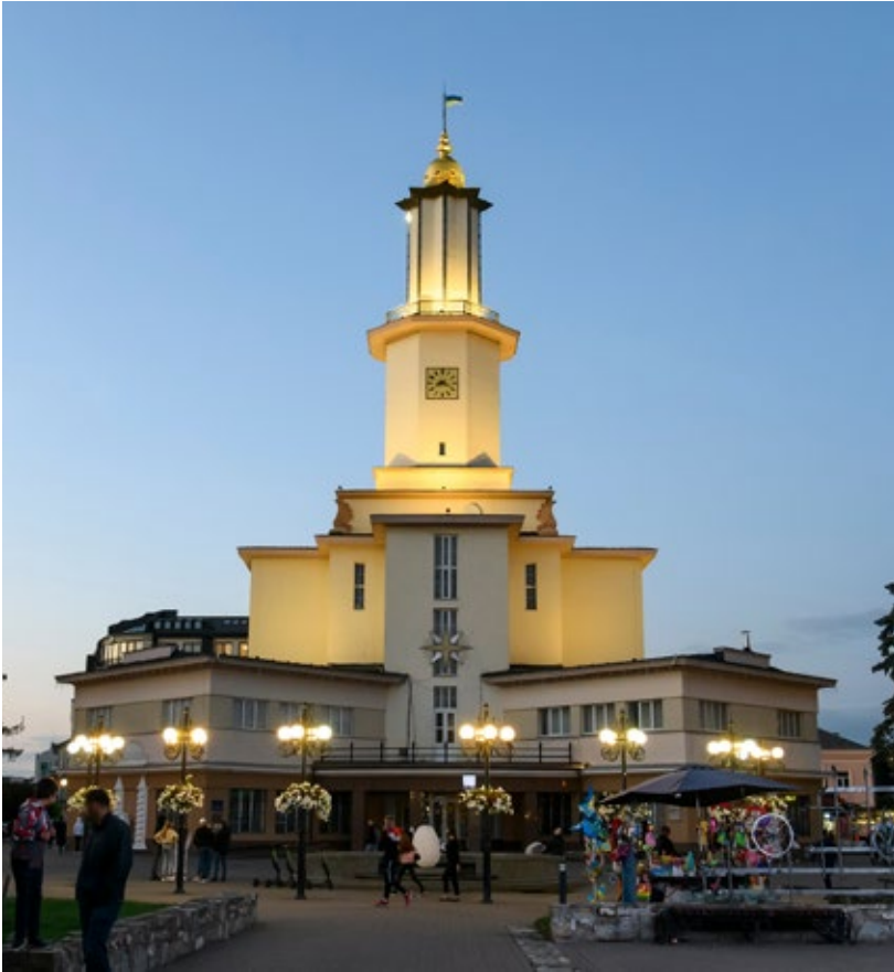
Rådhuset i Ivano-Frankivsk, September 2021.