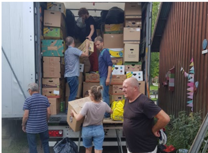
Lastbilen lastas i Solberga för transporten mot Ivano-Frankivsk.