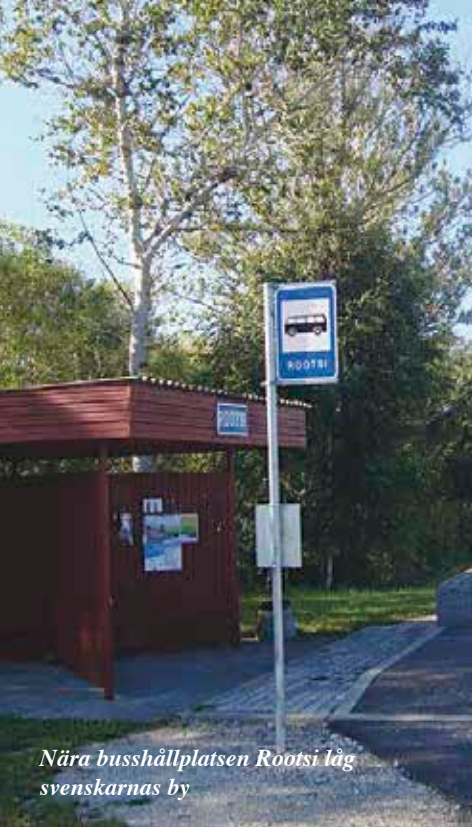
Nära busshållplatsen Rootsi lög svenskarnas by