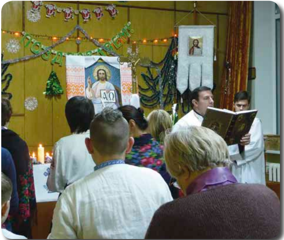
Jul i Ukraina.