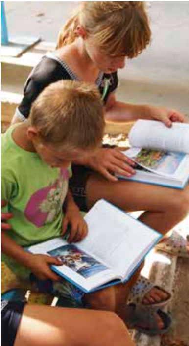
Några barn med sina nya biblar.

stånd och brister i kommunikationen, språkproblem, känslan av osäkerhet, motgångar osv. Listan är lång och några av dessa saker följde med oss nästan hela tiden. I något fall insåg jag att allt detta hör till saken, för vi jobbar ju för Jesus Kristus. Han själv sade att det inte kommer att vara lätt att följa Honom, och Han visste vad Han pratade om! Under de två månaderna i Ukraina fick jag verkligen uppleva hur det är att vara missionär: Inte alla är glada för att du är där och predikar Guds ord. Inte alla vill att du berättar för folk att det finns hopp, tack vare att Gud har gett sin enfödde Son så att vi alla skulle bli frälsta. Många vill bara dra nytta av dig eftersom du kommer från ett rikt land, och de tror att du inte är tillräckligt smart för att se när de försöker utnyttja din vänlighet. Men det budskap vi hade med oss var och är större än allt det vad en människa kan göra för oss!