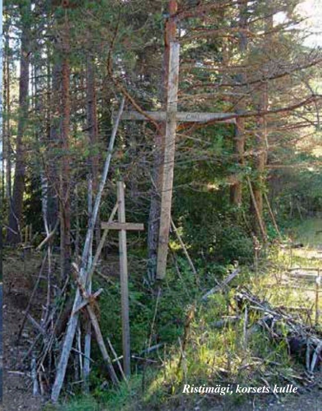
Ristimägi, korsets kulle