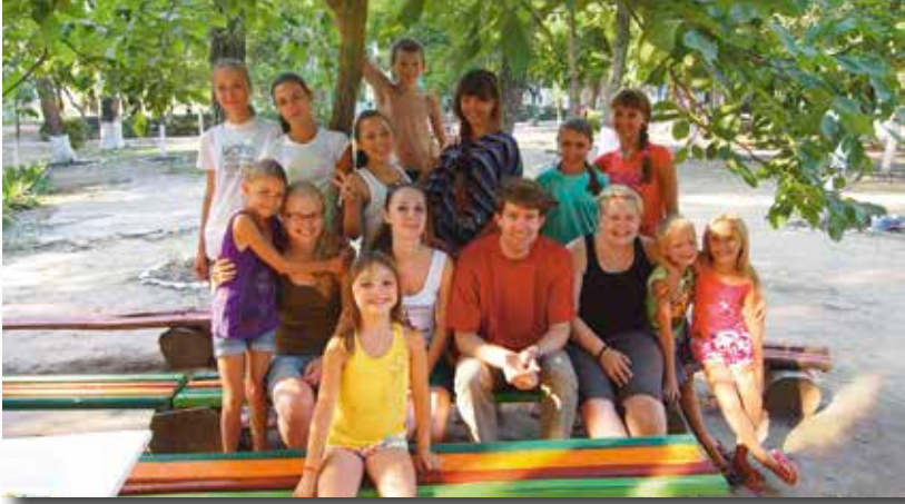
Vårt team med en grupp efter lektionen.