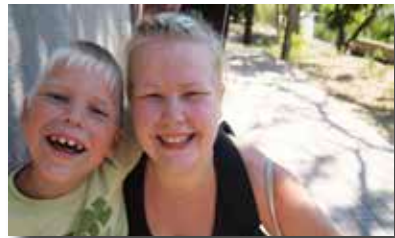
Sanni och Jura, en av dem som var en flitig deltagare.

gare hade fastnat i Kiev när vi kom till Odessa, kulturchock, missför-