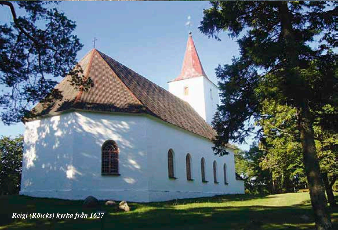
Reigi (Röieks) kyrka från 1627