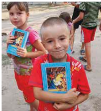
Barn med sina Biblar.